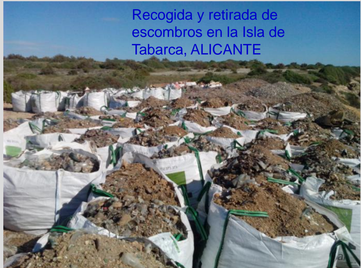
Recogida y retirada de escombros en la Isla de Tabarca, ALICANTE